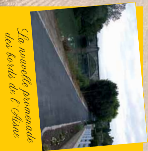
La nouvelle promenade des bords de l'Aisne