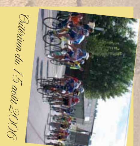
Pétitium du 15 août 2006