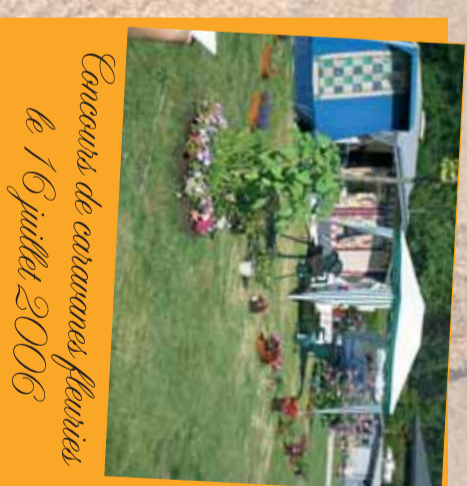
Concours de caravanes fleuries le 16 juillet 2006