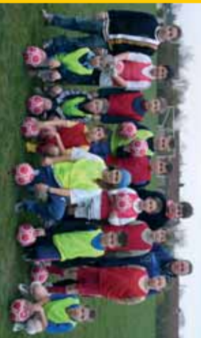
Entente Guignicourt-Evergnicourt, benjamins