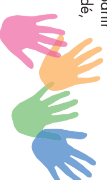
Plate-forme informatique de Condé :

Animé par le Relais Trotin-Trotine et Picardie en ligne : BB'clic à partir de 24 mois, à Condé, le 4 ème mercredi du mois à 9h, 10h et 11h.